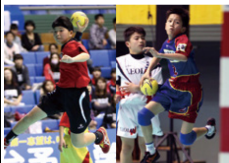
㊦琉球ジュニア・糸満㊧北電ジュニア・藤坂