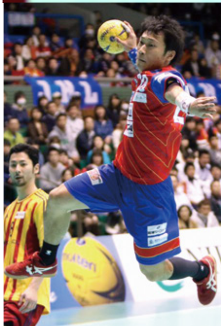
①大崎・信太④車体・光増⑤琉球・中村