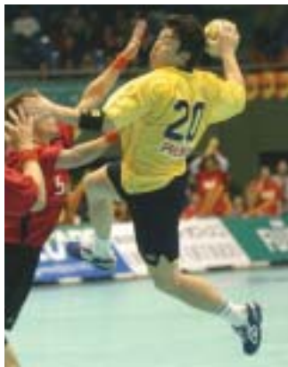
男子2位の大同特殊鋼・白